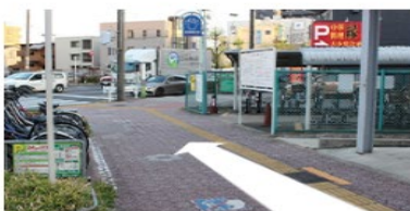
道順② 交差点歩道が見える