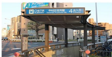
道順① 出口をでたらすぐ左へ (真っすぐはNG)