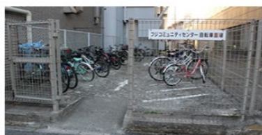
道順⑥ 建物のとなりが駐輪場