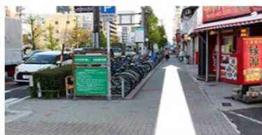
道順③ こがね陸橋方面へ