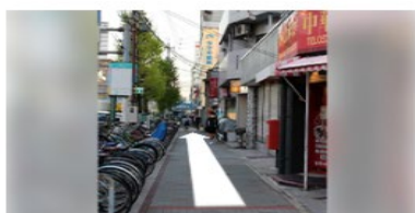
道順④ ここから真っすぐ140m