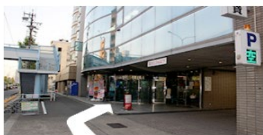
道順⑦ 到着です 中村区役所駅4番出口から徒歩2分 (150m)