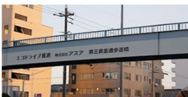
道順⑤ 大通りに歩道橋が見えてきます