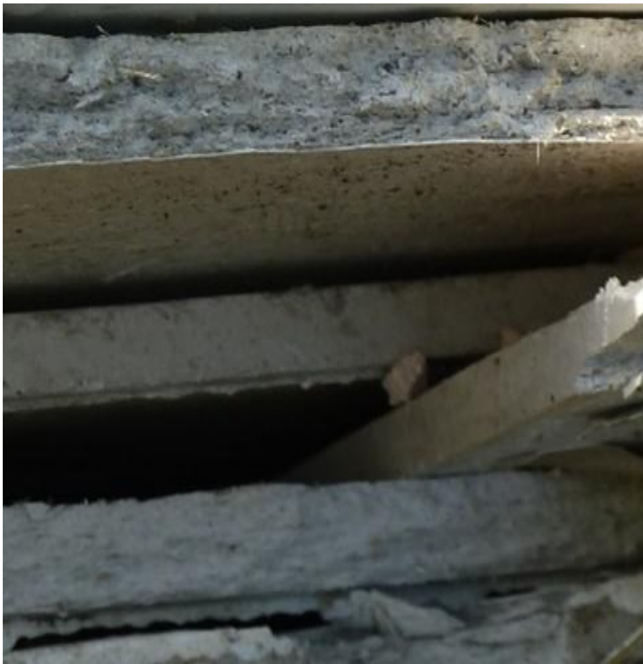
Loose-fill asbestos (ゆるく貼り付けられたアスベスト)