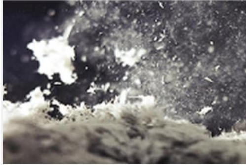
Release of loose-fill asbestos fibres