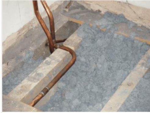
Loose-fill blue asbestos under floorboards