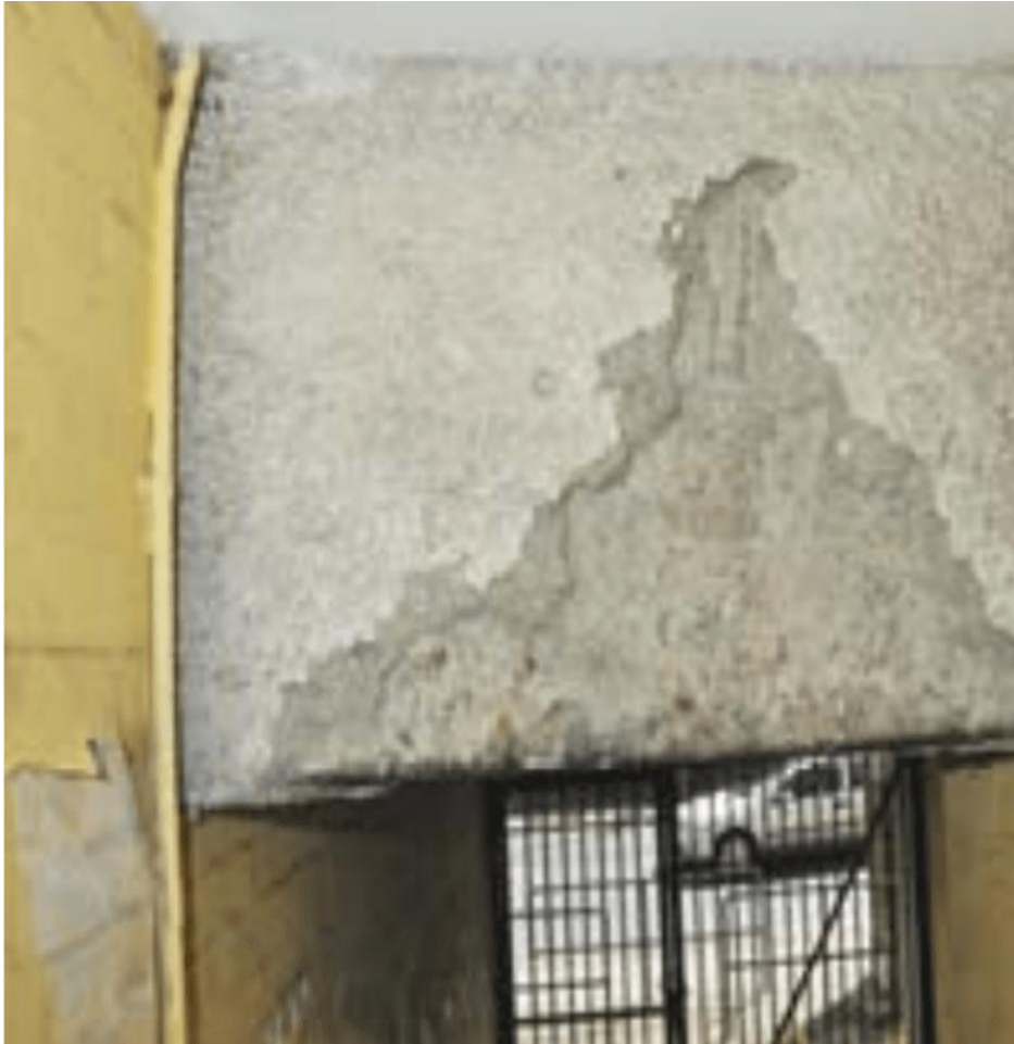
Loose asbestos cavity insulation (緩いアスベストキャビテ)