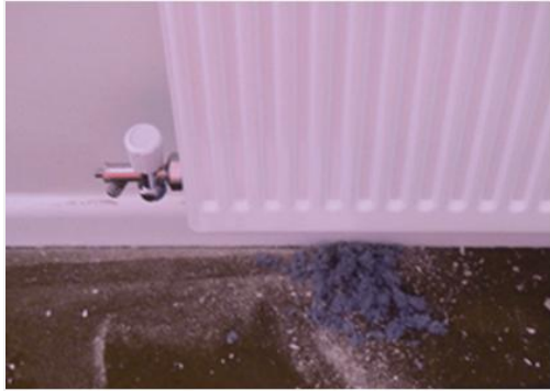
Loose-fill blue asbestos in wall cavity drilled out whilst fitting a radiator