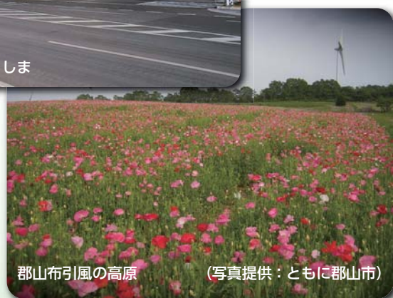
郡山布引風の高原