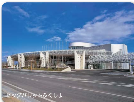
ビッグパレットふくしま

企業の労働衛生担当者の皆様と労働衛生にご関心のある方の多数のご来場をお待ちいたします。