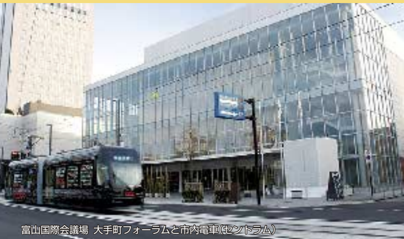
富山国際会議場 大手町フォーラムと市内電車(セシトラム)